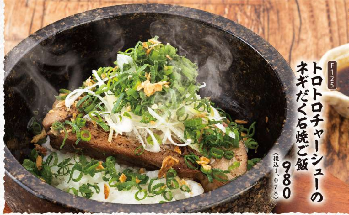
F125 トロトロチャーシューの ネギだく石焼ご飯