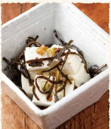
F23 塩昆布まみれの クリームチーズ 400 (税込440)