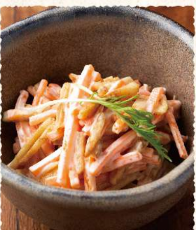
F21 無限にんじん 400 (税込440)