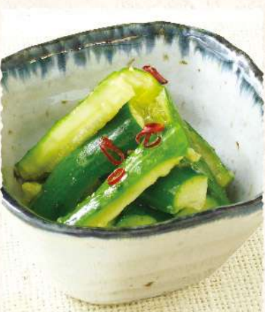
F13 ピリ辛たたき胡瓜 390 (税込429)