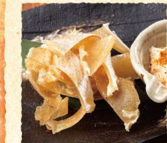
F41 炙り えいひれ 580 (税込638)