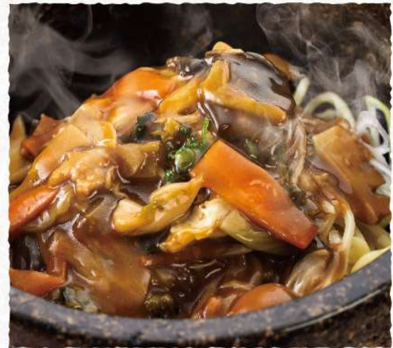
F127 五目あんかけ 石焼そば