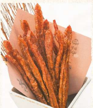
F14 サクサク!! スパイシースティック 390 (税込429)