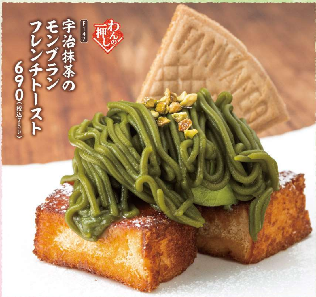
F147 わんの押し 宇治抹茶の モンブラン フレンチトースト 690 (税込759)