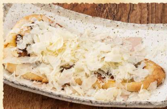
F55 キーマカレーと ふんわりチーズの ナンビザ 980 (税込1,078)