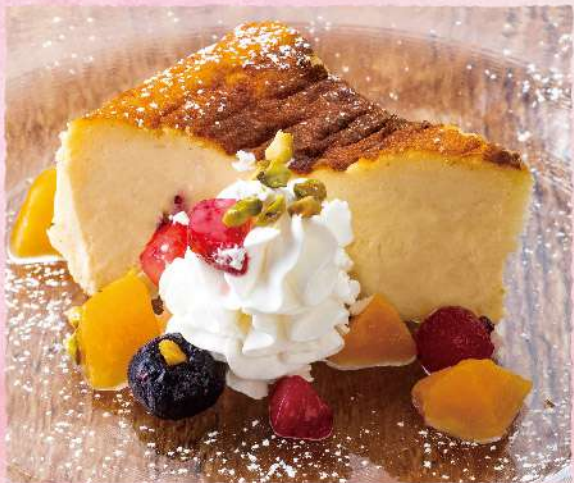
F144 しっとりチーズケーキ ほのかな山椒風味 クリーミーなチーズケーキに 爽やかな山椒の香りと風味が プラスされた味わい深い一品です。 620 (税込682)