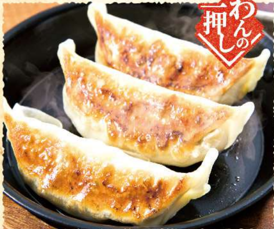
F54 でっかい!! 熱々鉄板餃子 590 肉汁あふれる鉄板餃子。 (税込649)