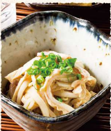
F11 もつポン 400 (税込440)