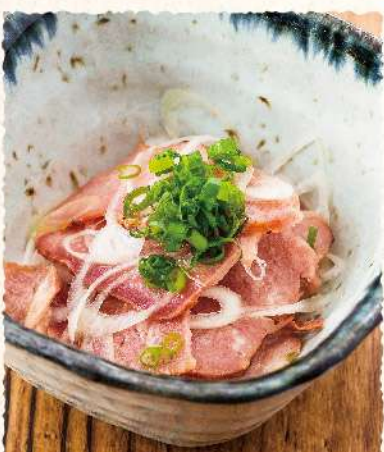
F17 葱タン塩レモン和え 490 (税込539)