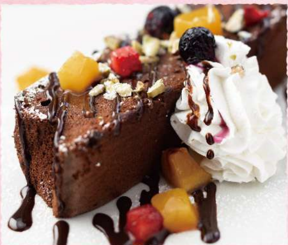
F145 もちふわ 台湾チョコカステラ ふわふわの食感の 柔らかかチョコカステラ！ 640 (税込704)