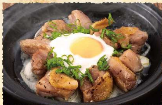
F57 親鳥の旨辛焼き 温玉添え 740 (税込814)