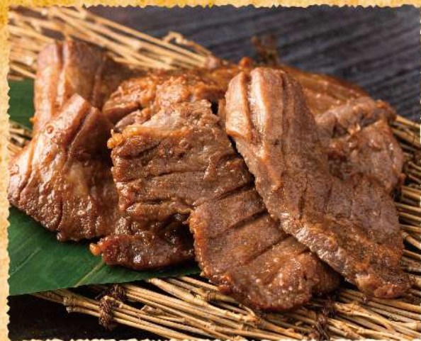
F46 仙台味噌で漬けた 牛タンの炙り焼き 1,450 (税込1,595)