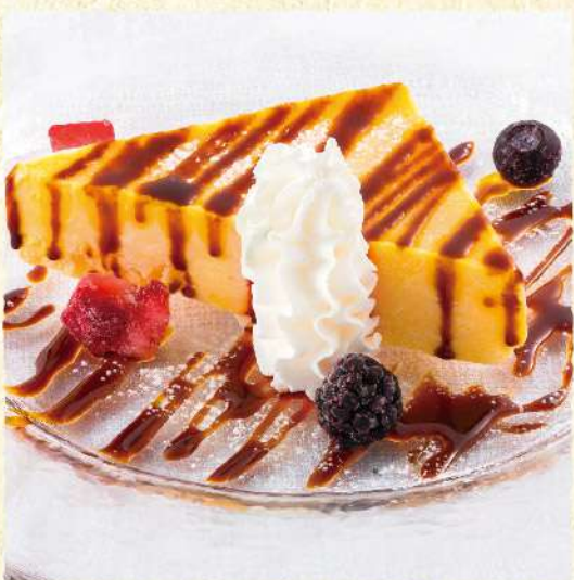
F143 カスタードアイスケーキ ”カタラーナ” 550 (税込605)