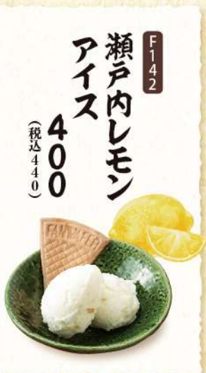
F142 瀬戸内レモン アイス 400 (税込440)