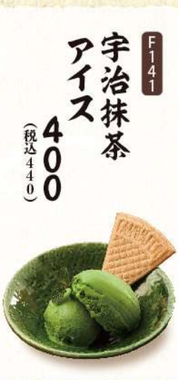
F141 宇治抹茶 アイス 400 (税込440)