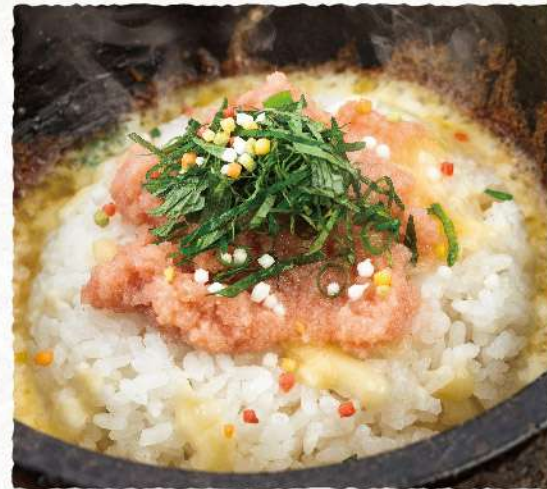
F126 焦がしチーズと たつぷりたらこの 石焼ご飯