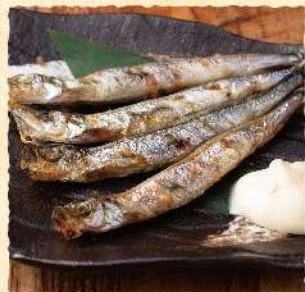
F40 子持ち ししやも 500 (税込550) ※カマフラットししやもになります。