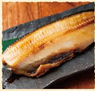
定番 F47 しまホツケ (半身) 790 (税込869)