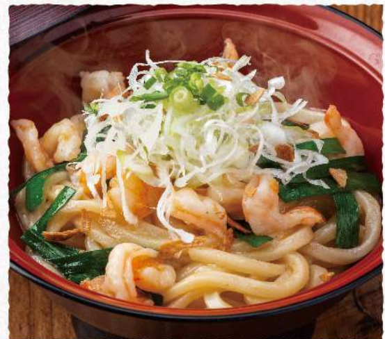
F124 香り抜群! 海老焼きうどん