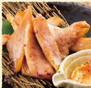
F42 やわらか イカ焼き 500 (税込550)