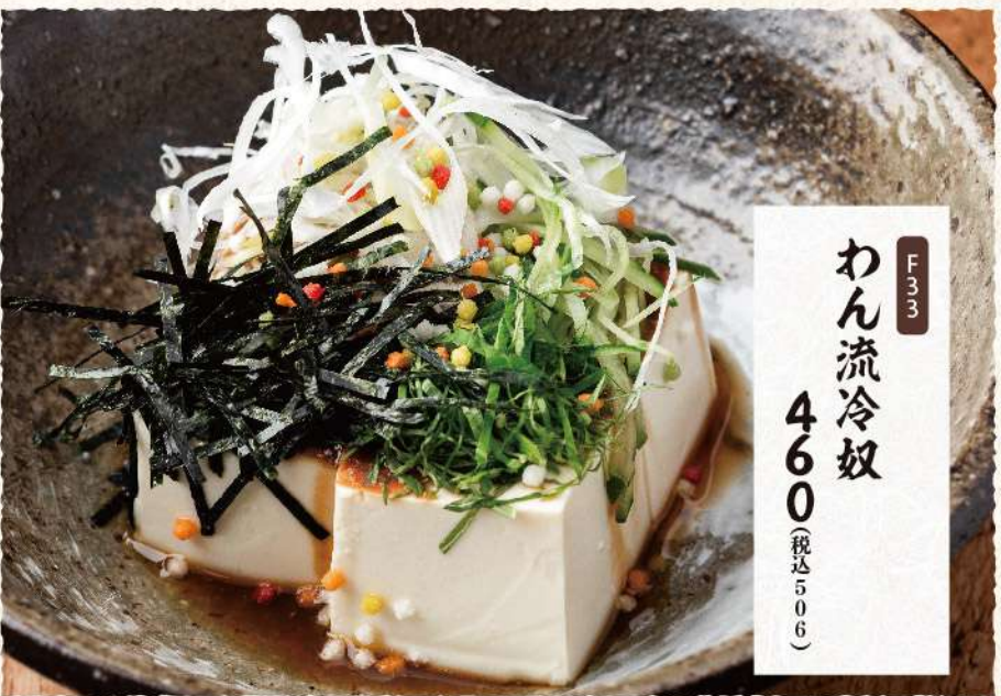
F33 わん流冷奴 460 (税込506)