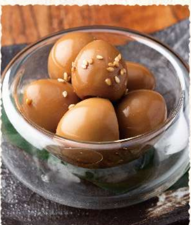
F20 おつまみ玉子 420 (税込462)