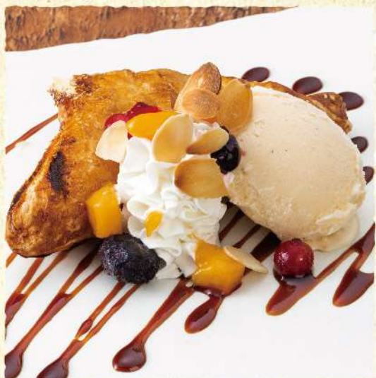
F146 キャラメルアップルパイ バニラアイス添え 690 (税込759)