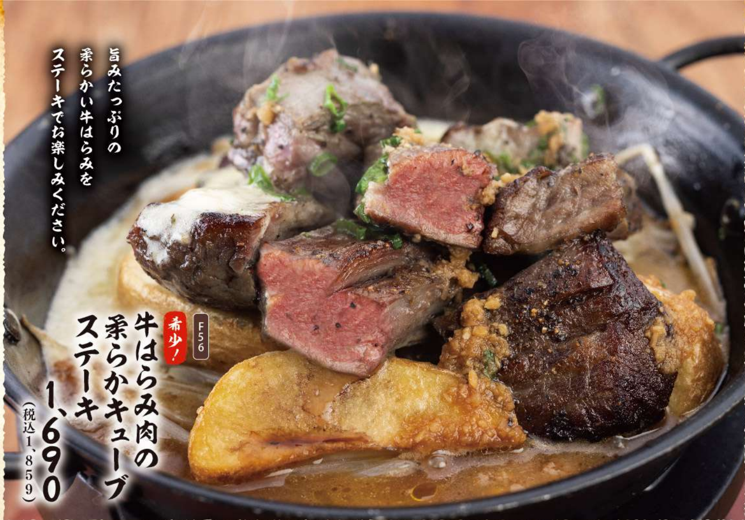
F56 希少! 牛はらみ肉の 乗らかキューブ ステーキ 1,690 (税込1,859)